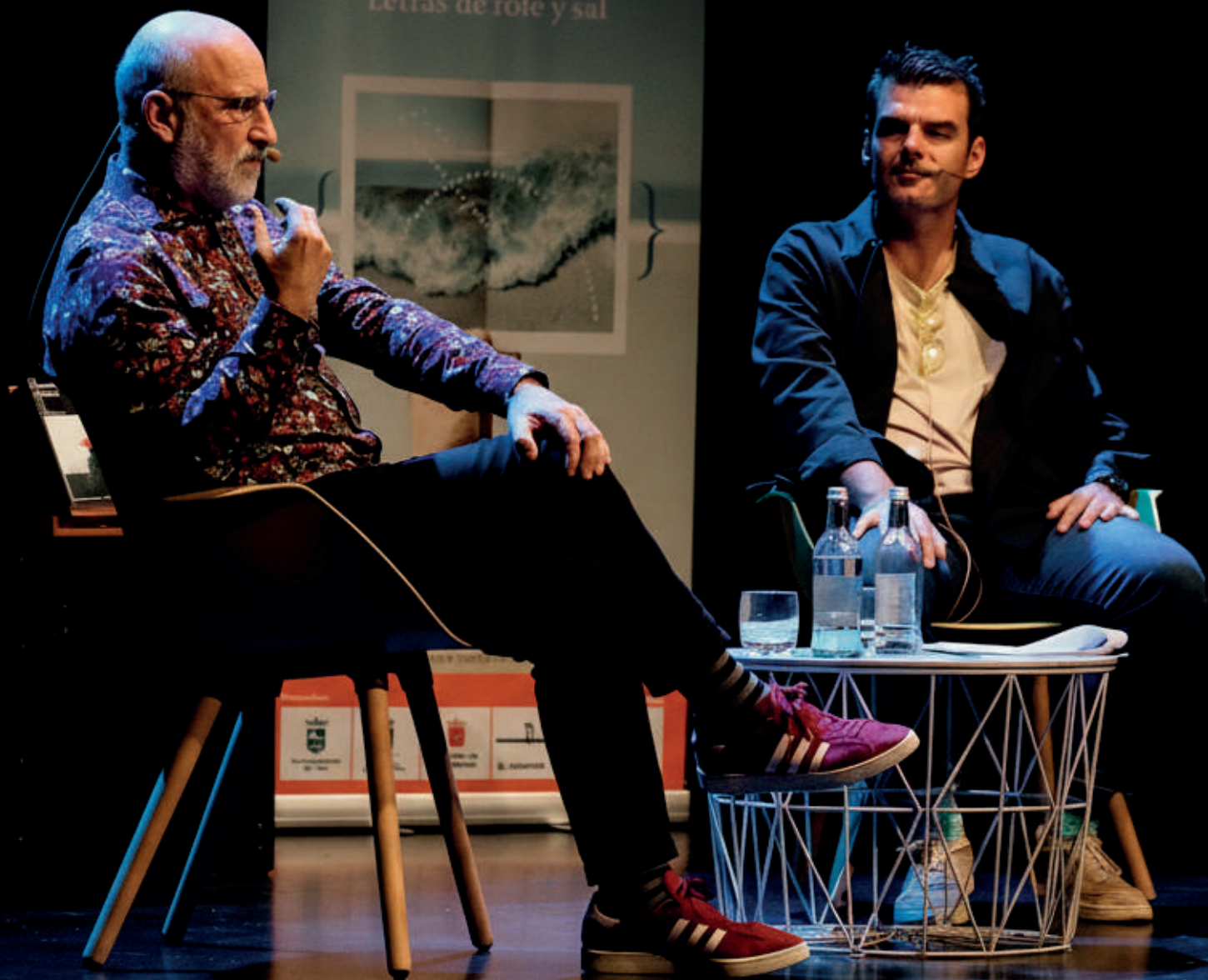
Charla de Fernando Aramburu